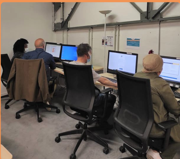
Le nouvel espace numérique de Neptune